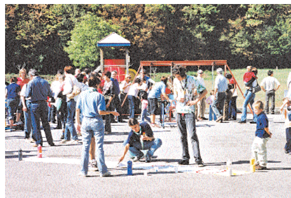
Lo spazio giochi