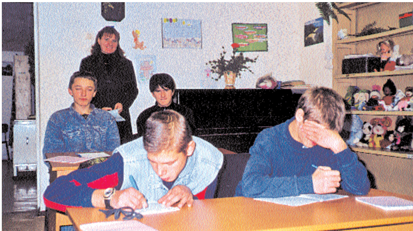
L'aula scolastica del Centro di riabilitazione per ragazzi di strada, nel quartiere di Goloseevsky, a Kiev, gestito dall'associazione "Cuore aperto"

coglierli per qualche ora: "ma abbiamo visto subito che non bastava - spiega - perché molti ragazzi erano per strada anche da 5-7 anni e ormai era difficile recuperarli in quel modo, serviva un lavoro più lungo e completo. Così è nato il Centro di riabilitazione, cercando nel contempo di convincere lo Stato del fatto che questi ragazzi non possono stare in orfanotrofio e che occorrono strutture diverse".