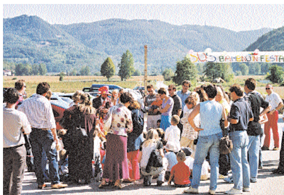
La cornice dei Berici alla festa

Al termine si è svolta la ricca lotteria il cui ricavato insieme a quello del "salvadanaio" è stato devoluto ai progetti di Sos Bambino a sostegno dell'infanzia abbandonata. Il primo premio ha regalato ad una coppia un viaggio in Tunisia, ma sono stati assegnati numerosi altri premi tra cui una moto elettrica per bambini, una stampante, ecc. Credo di poter di-