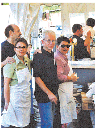
Un gruppo di addetti alla distribuzione dei pasti

re che la festa del 14 Settembre è stata un successo per diversi motivi: perché ho constatato la partecipazione sentita sia degli organizzatori, che colgo l'occasione di ringraziare ufficialmente, sia di tutti coloro che hanno partecipato con spirito familiare e di amicizia, ma soprattutto di coloro senza i quali non ci sarebbe festa né a Fimon né nei nostri cuori, e cioè i bambini. □