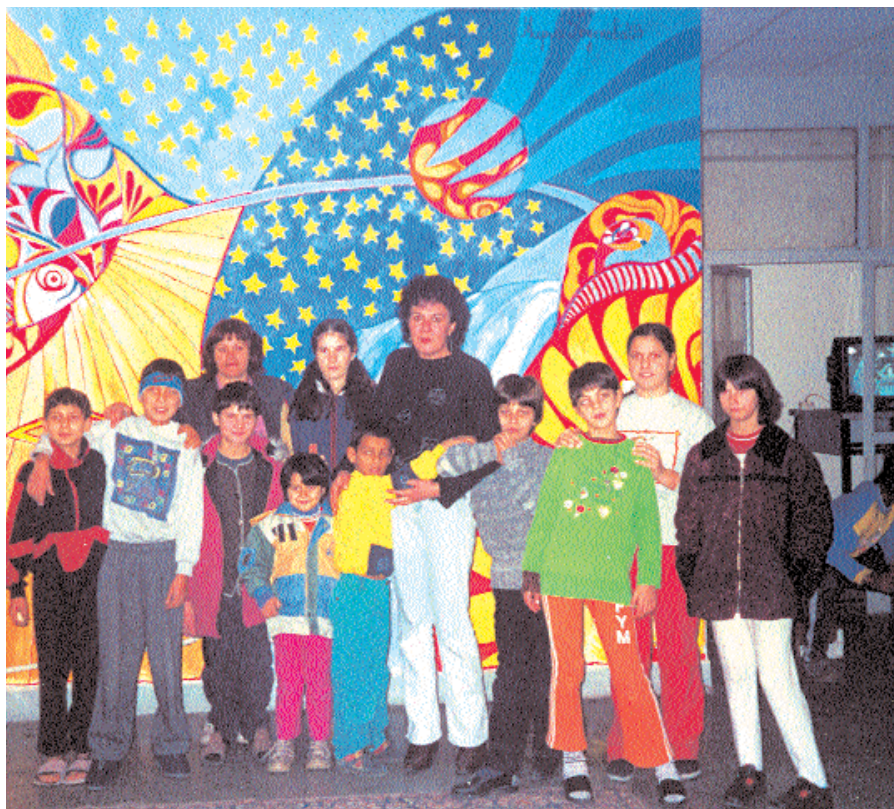
I bambini del progetto "Hansel e Gretel". Foto di gruppo per gli amici italiani. "Hansel e Gretel" è il primo progetto approvato e cofinanziato dalla Commissione adozioni internazionali italiana, nell'ambito della cooperazione prevista dalla Convenzione dell'Aja

ca, Sos Bambino ha realizzato la formazione degli insegnanti della scuola pubblica, della scuola per Rom di Valea Lui Stan e della scuola materna Caritas del Comune di Brezoi.