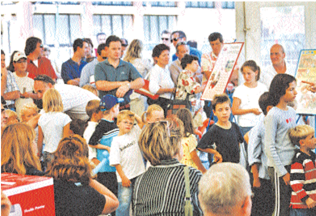
In attesa della lotteria... e un fortunato vincitore