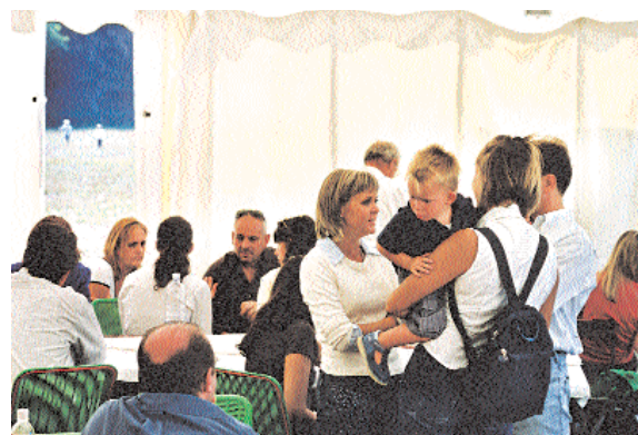
Scambio di opinioni