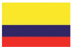
Per le strade di Bogotá. Foto degli "Invisibles" di Adriana Gómez