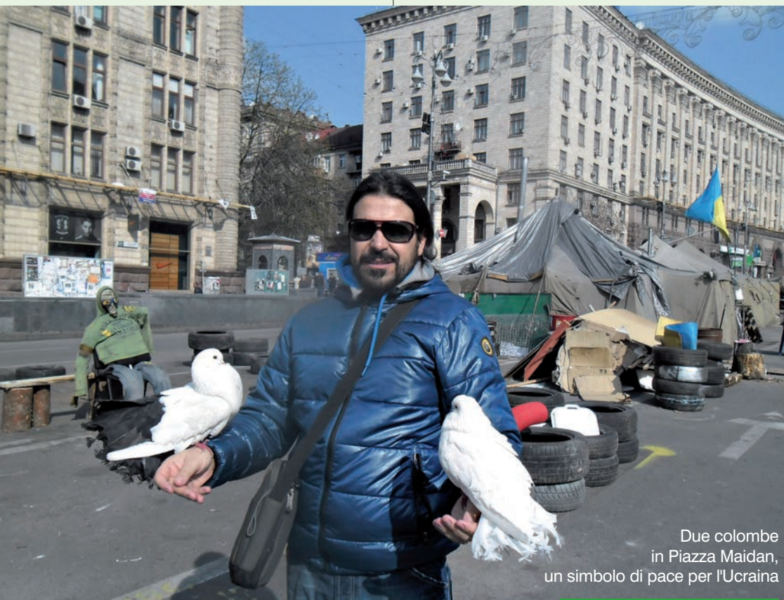
Due colombe in Piazza Maidan, un simbolo di pace per l'Ucraina

Nel frattempo il tg online di domenica 2 marzo ci fa sprofondare in una immensa tristezza. E' interamente dedicato alla questione Ucraina, con Putin che vuole far valere i